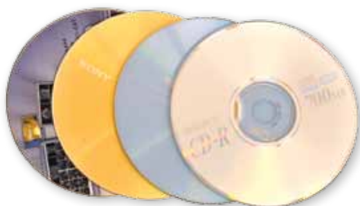
Płyty CD/DVD bez okładek

Wszystkie rodzaje baterii zbieramy do osobnej torebki, zawiązaną torebkę wrzucamy do worka.